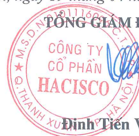
Đình Tiên Vịnh